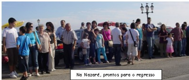
Na Nazaré, prontos para o regresso

Deixando para trás Peniche e a sua beleza natural seguimos para o local principal do nosso passeio; a Vila histórica de Óbidos.