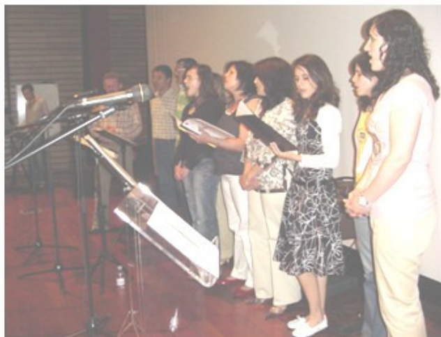
Participação do Grupo Coral da igreja em Algeriz

A dez de Junho a nossa igreja teve mais uma vez a seu cargo a Reunião de Jovens Inter-Igrejas.